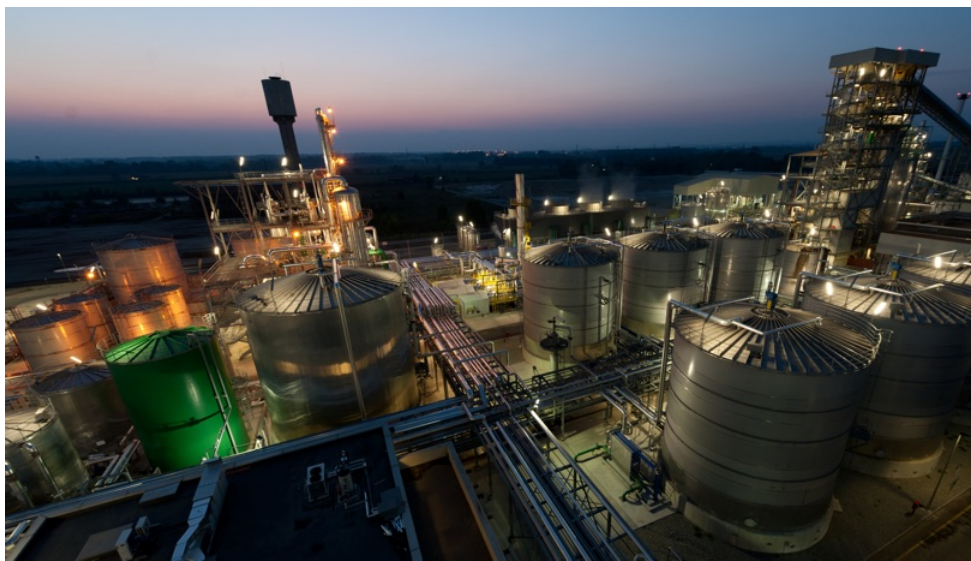
La chimica italiana

archivia un 2015 con la produzione in leggera crescita rispetto all'anno precedente (+0,8%) grazie al buon andamento delle esportazioni (+4,5% in volume) e, per la prima volta dopo anni, alla ripresa della domanda interna (+1,2%), che ha spinto in alto anche le importazioni di prodotti chimici (+4,3%). A testimoniare il risveglio del comparto è l'ultima edizione dell'osservatorio congiunturale di Federchimica, che riporta anche i preconsuntivi, basati sui primi nove mesi dell'anno, dei consumi di materie plastiche in Italia ( leggi articolo ).