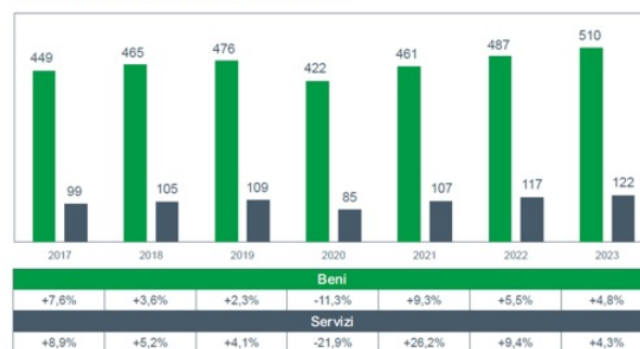
Esportazioni italiane di beni e servizi in valore (miliardi di euro; var. % annua)

Si tornerà ai livelli del 2019 già l'anno prossimo,