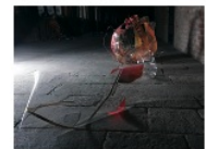
Sezione Merck A. Angelini - "Abbraccio"